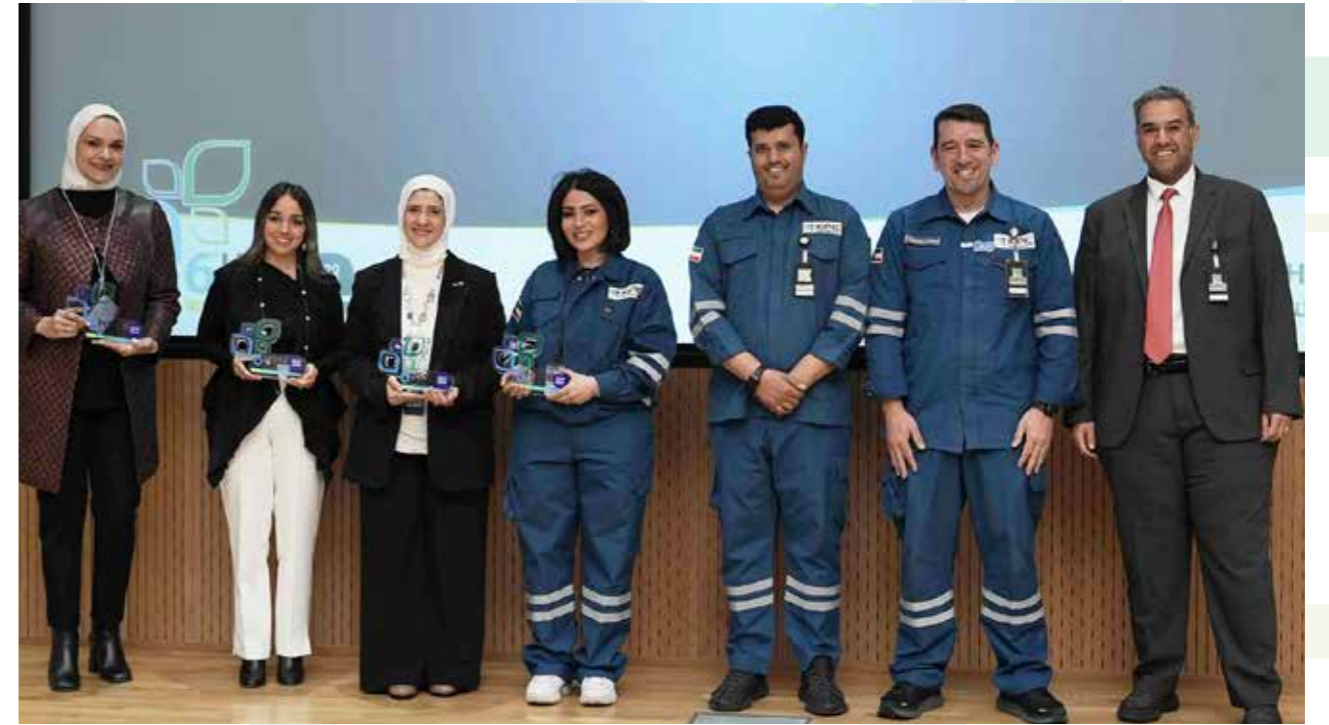
في الدعيج محلل مراكز التدريب مجموعة التدريب والتطوير الوظيفي

تعد هذه الحملة جزءاً من التزام "كيبك" بضمان سلامة عامليها على الطرق.