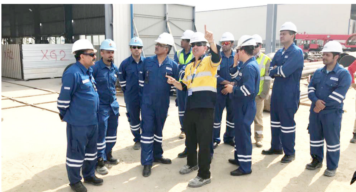
شرح لسير العمل في المنطقة

وأضاف: الزيارة كانت ناجحة ولسنا حرص المقاولين على راحة العمال وسلامتهم.