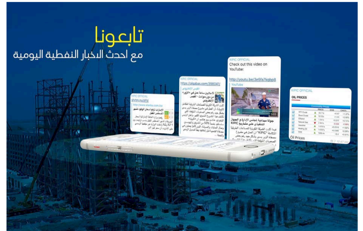
أبرز الأخبار النفطية

المريئة. وتشمل هذه النشرة اليومية، التي تبث في تمام الساعة الثانية عشرة من صباح كل يوم، كافة الأخبار النفطية المنشورة في الصحف المحلية، وكذلك الأخبار