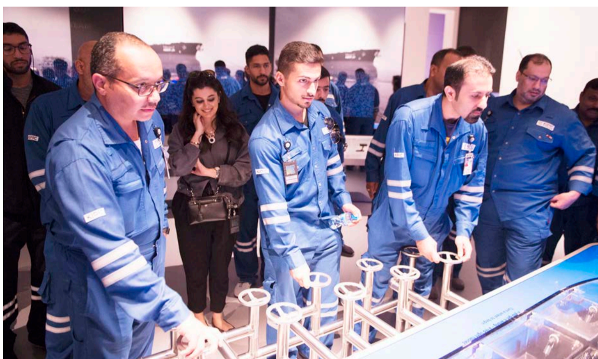
المعرض يحوي مقتنيات لبداية فترة اكتشاف البترول في البلاد