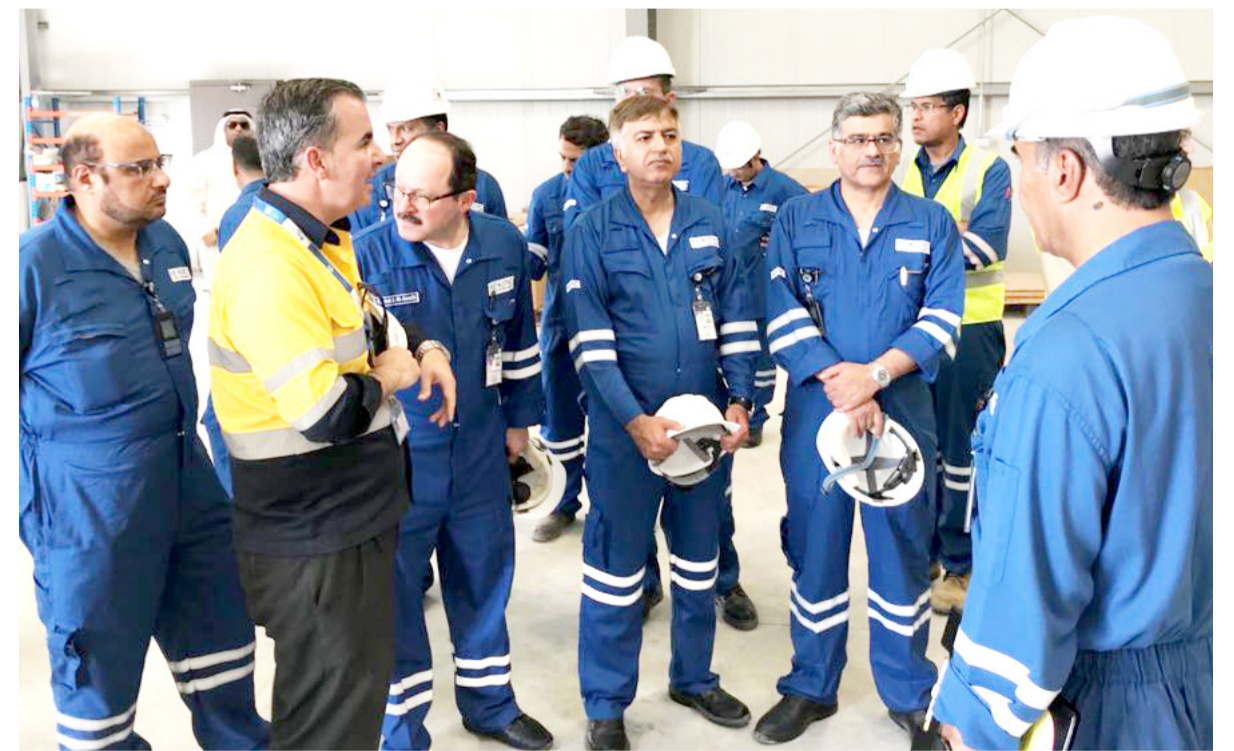
الاطمئنان على منطقة سكن العمال

قامت إدارة الشركة الكويتية للصناعات البتروولية المتكاملة بجولة ميدانية في مناطق سكن العمال وذلك للاطمئنان على منطقة سكنهم وتوافر كل الاحتياجات اللازمة لهم ليتمكنوا من أداء عملهم.