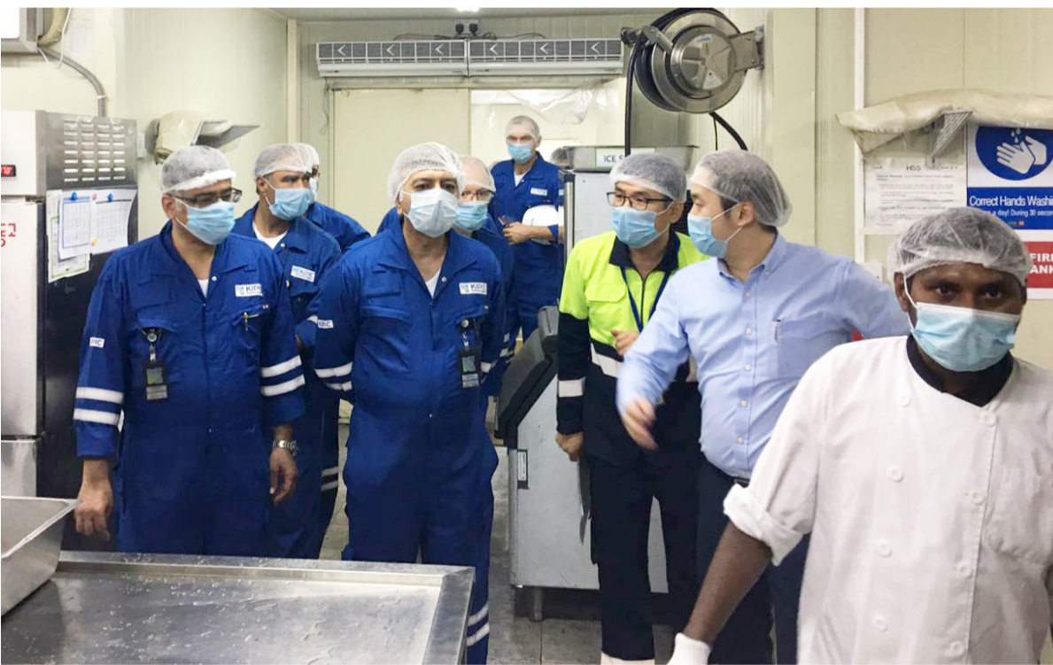
التأكد من توفر كل وسائل الأمن