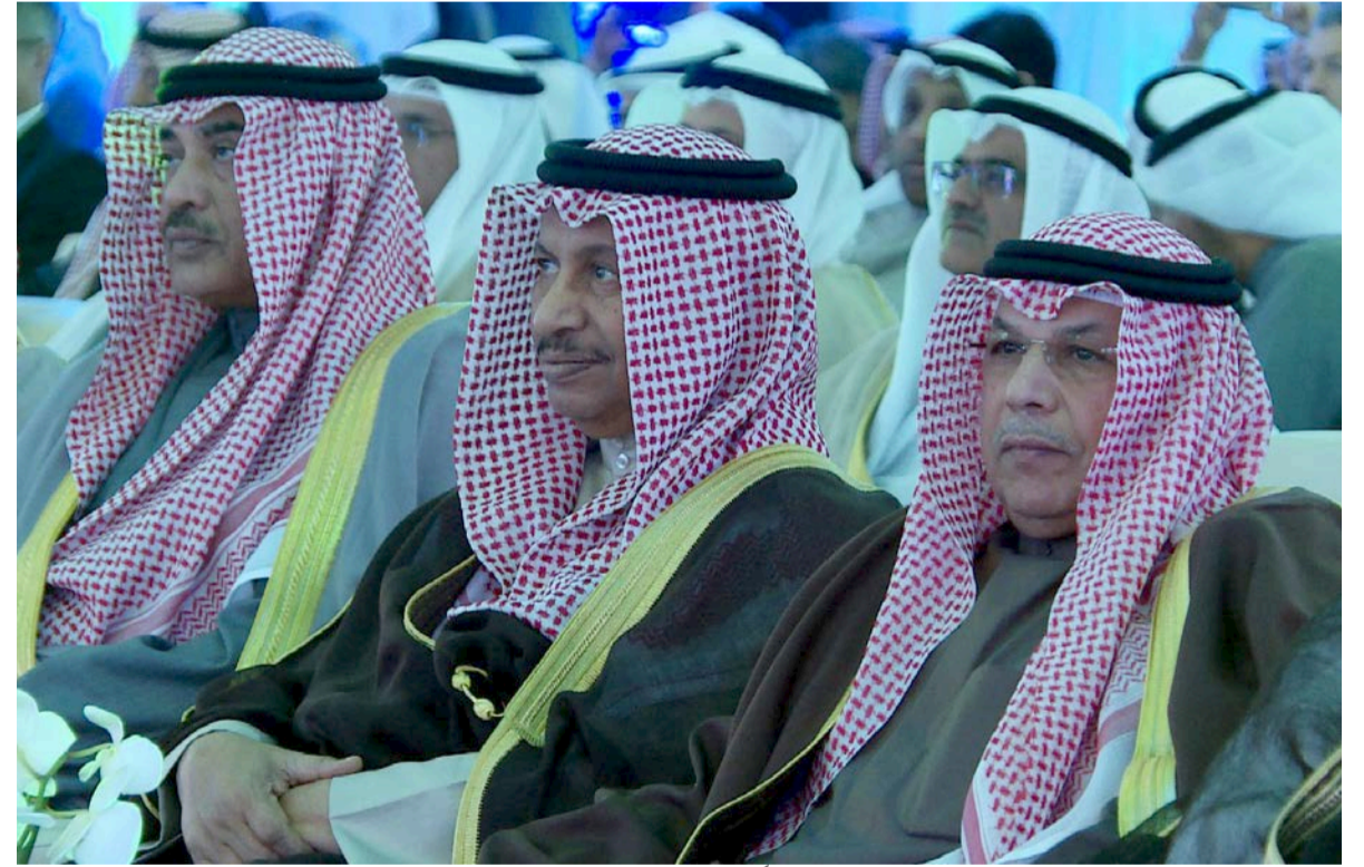
سمو رئيس مجلس الوزراء الشيخ جابر المبارك الحمد الصباح متوسلاً الشيخ خالد الجراح الصباح

المرزوق: مشروع مصفاة الزور جاء بهدف إنتاج زيت الوقود ذي المحتوى الكبريتي المنخفض ليغذي محطات القوى الكهربائية بالوقود اللازم