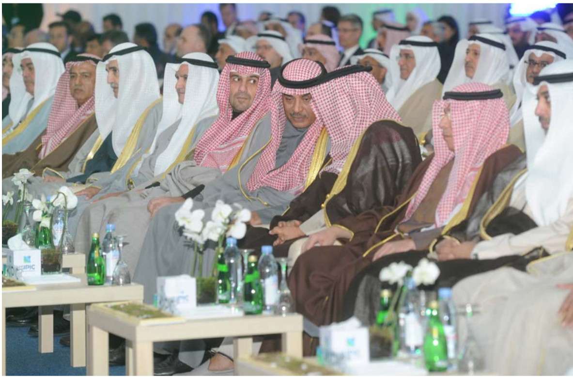
سمو رئيس مجلس الوزراء في حديث مع الشيخ صباح خالد الحمد الصباح

وفيما شدد على الأهمية الاستراتيجية لهذا الصرح النفطي الكبير والدور الحيوي الذي تلعبه مؤسسة البترول الكويتية وشركاتها التابعة في دعم الاقتصاد الوطني، وانطلاقاً من حرص المؤسسة على تحقيق دورها الرئيسي بتوفير الوقود لجهات الدولة