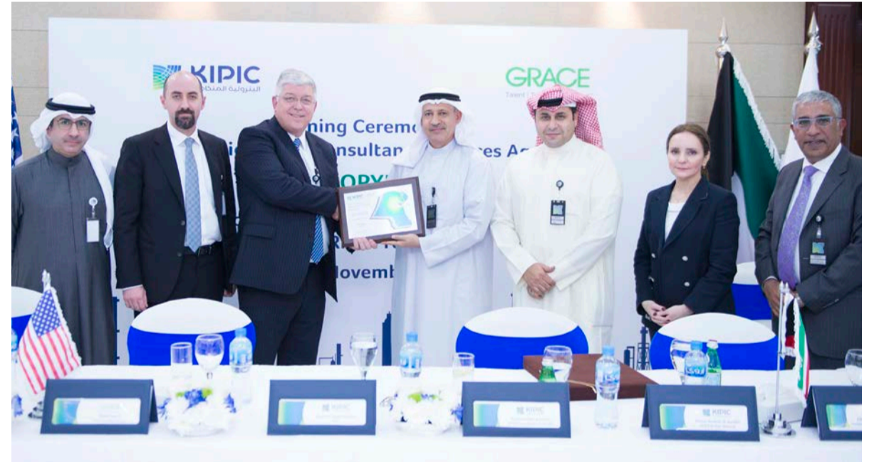
الجيماز مكرماً هريتل