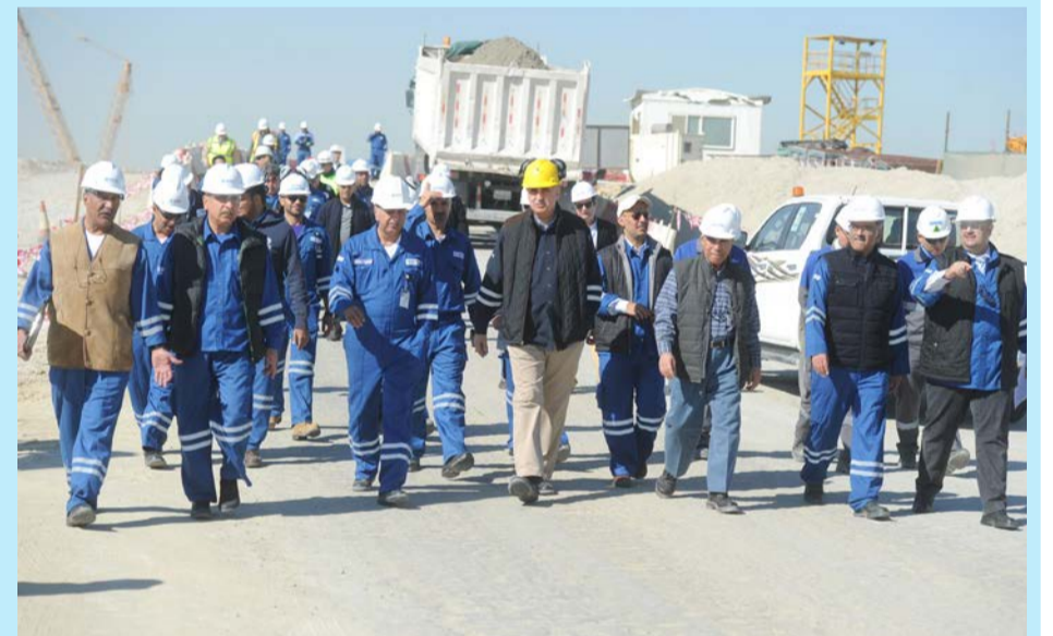
مجلسي إدارة مؤسسة البترول الكويتية والشركة الكويتية للصناعات البتروولية المتكاملة أثناء الجولة الميدانية

لتتبع مصادر الدخل. وعن الإضافة التي ستشكلها البتروولية المتكاملة للقطاع النفطي، أوضح قائلاً: تعد أول شركة على أرض الكويت بها تكامل بين صناعة البتروكيماويات والمصفاة ونأمل أن تسير الشركات الأخرى في هذا التوجه.