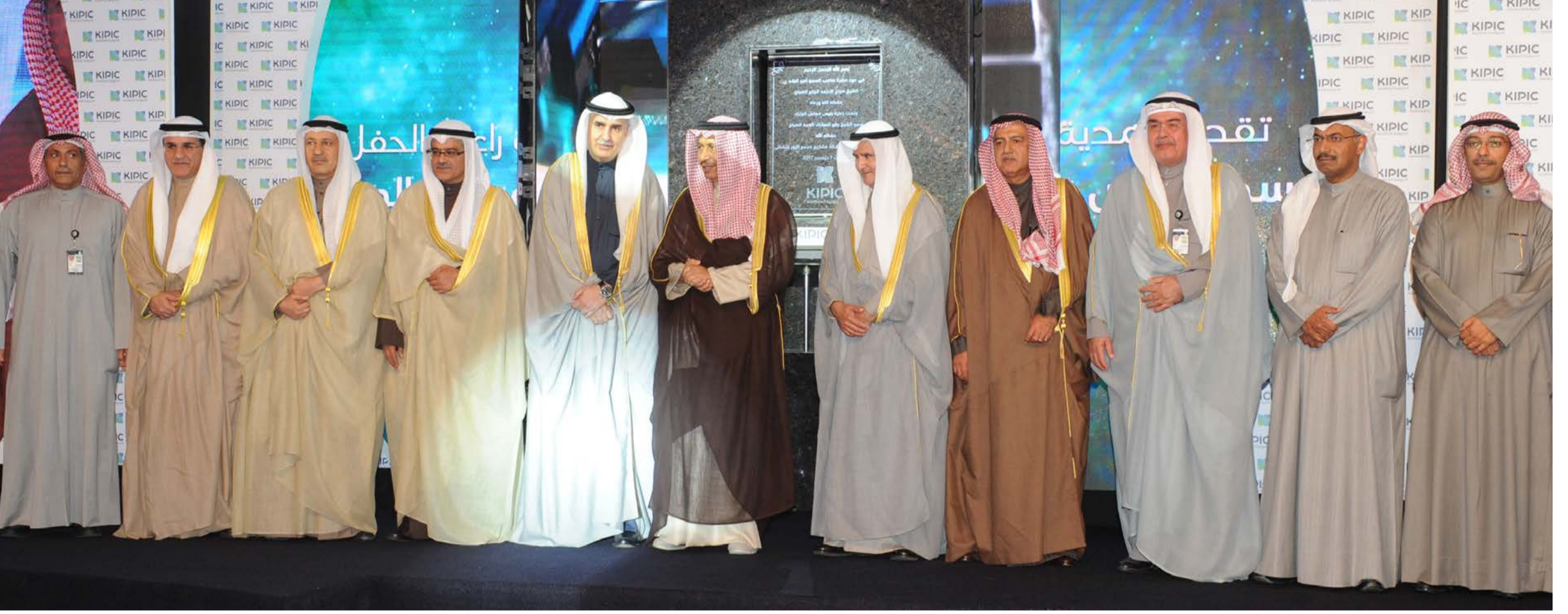
سمو رئيس مجلس الوزراء الشيخ جابر المبارك الحمد الصباح متوسلاً المزروق والعدساني، ويبدو هاشم ويخش

جابر المبارك: الحكومة مستمرة في دراسة وتنفيذ المشاريع الاستراتيجية والتنمية، على مختلف القطاعات النفطية وغير النفطية