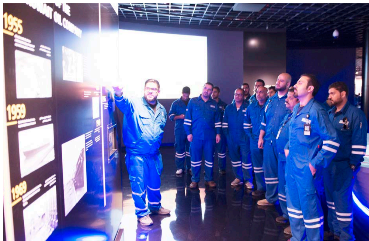
شرح مقتنيات المعرض