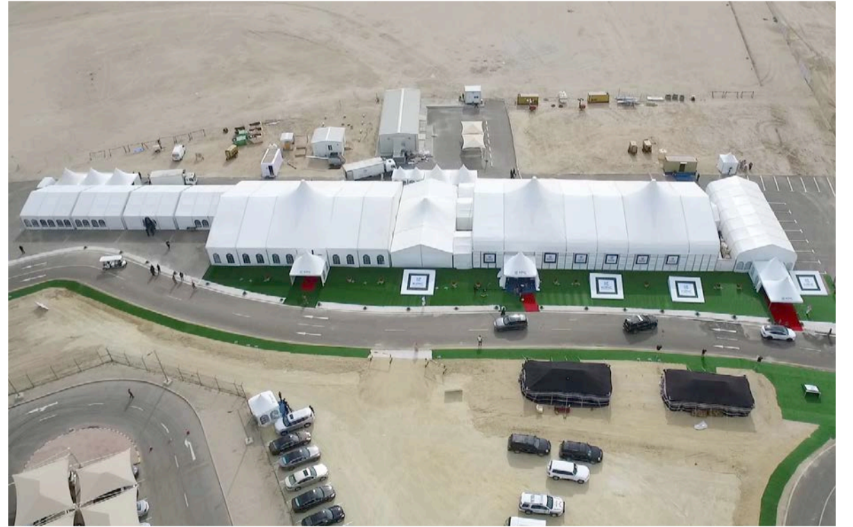
منظر جوي لمكان الاحتفالية