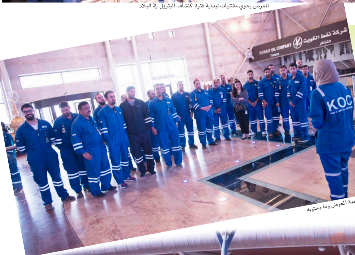
شرح لأهمية المعرض وما يحتويه