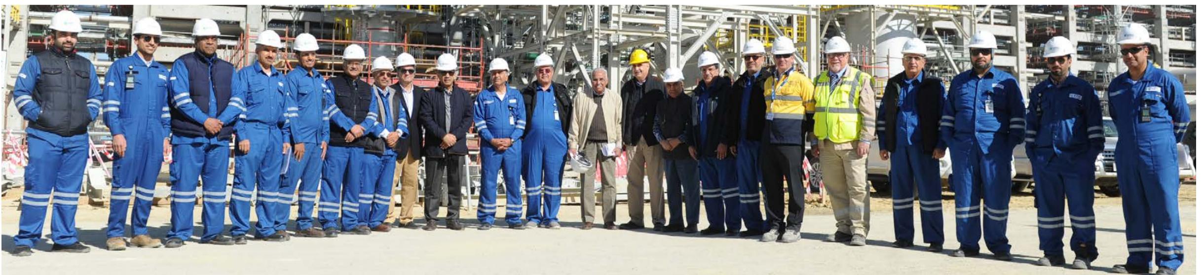
لقطة جماعية لأعضاء مجلس إدارة مؤسسة البترول الكويتية والشركة الكويتية للصناعات البترولية المتكاملة