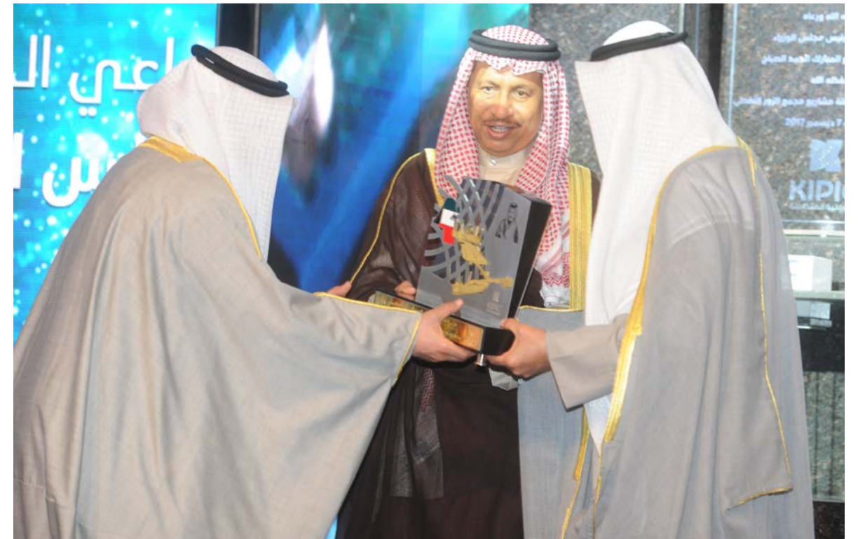
تكريم سمو رئيس مجلس الوزراء