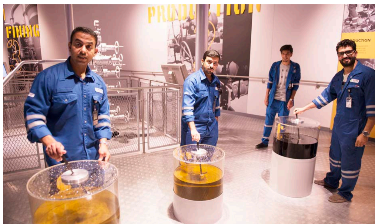
عدد من مهندسي البتروولية المتكاملة