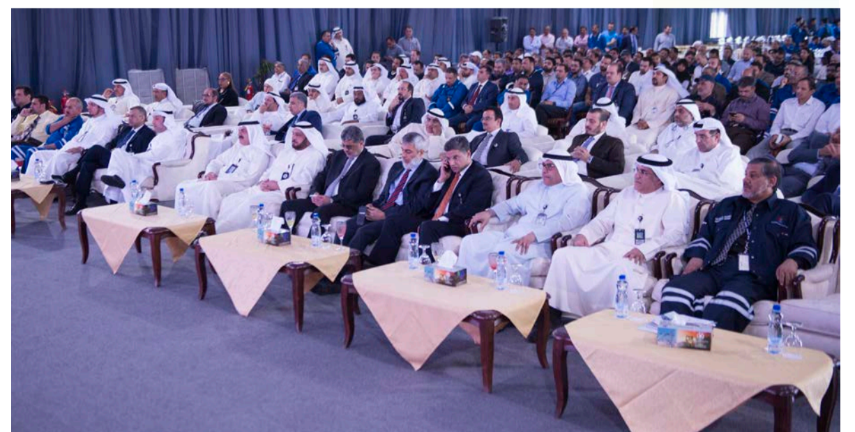
عدد من القيادات النفطية في مقدمة الحضور