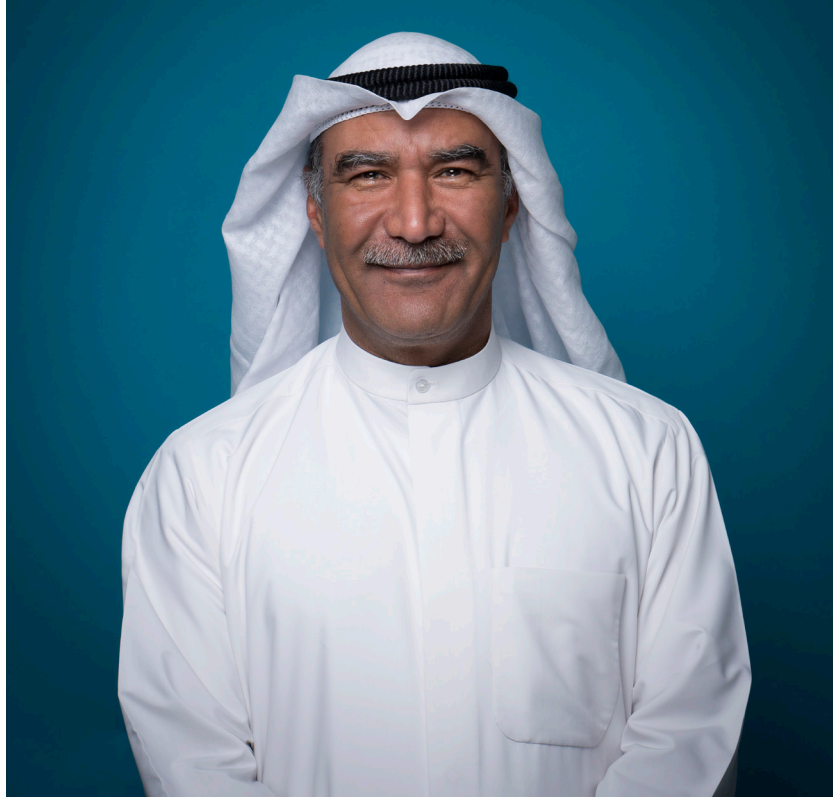
رئيس اللجنة الدائمة لجائزة الرئيس التنفيذي للصحة والسلامة والأمن والبيئة Chairman of CEO HSSE Award Committee of the CEO HSSE Award